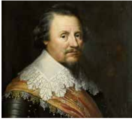
Ernst Casimir (1573-1632), stadhouder van 1620-1632