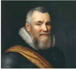
Willem de Zwijger (1533-1584), prins van Oranje, stadhouder van Holland, Zeeland en Utrecht 1572-1584, vanaf 1580 ook Friesland, Groningen, Drenthe en Overijssel