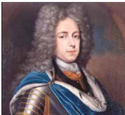
Hendrik Casimir II (1657-1696), stadhouder van 1664-1696