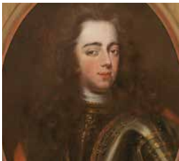
Johan Willem Friso (1687-1711), stadhouder van 1696-1711 en prins van Oranje