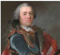
Willem Carel Hendrik Friso (1711-1751), stadhouder van 1711-1751 en prins van Oranje, vanaf 1747 als Willem IV van alle gewesten van de Republiek der Verenigde Nederlanden