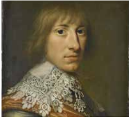
Hendrik Casimir I (1612-1640), stadhouder van 1632-1640