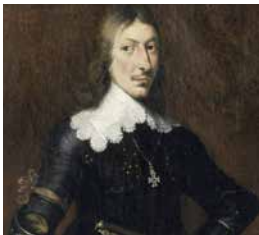
Willem Frederik (1613-1664), stadhouder van 1640-1664